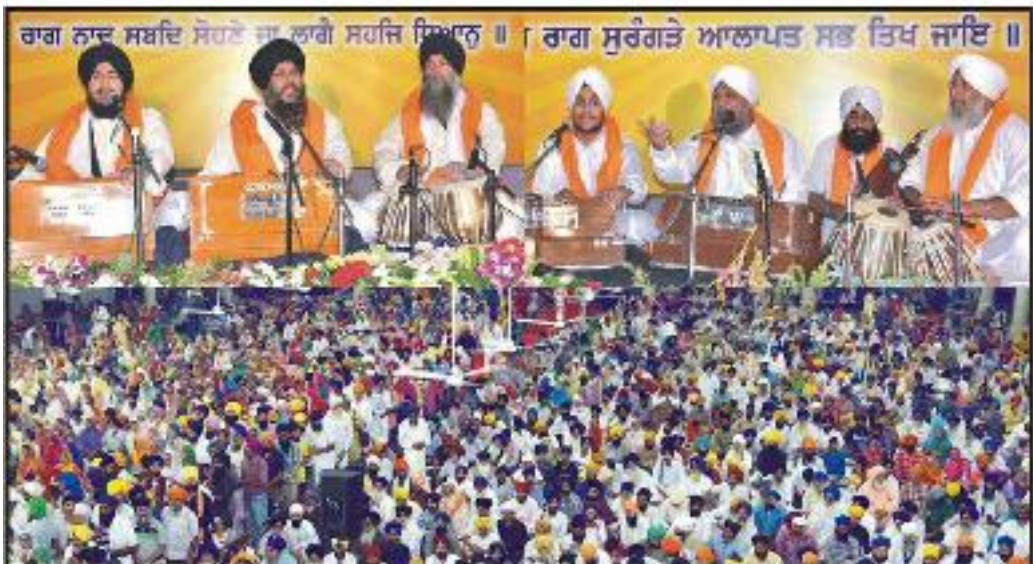
ਸ੍ਰੀ ਗੁਰੂ ਰਾਮਦਾਸ ਜੀ ਦੇ ਪ੍ਰਕਾਸ਼ ਦਿਵਸ ਨੂੰ ਸਮਰਪਿਤ ਗੁਰਦੁਆਰਾ ਸ੍ਰੀ ਮੰਜੀ ਸਾਹਿਬ ਦੀਵਾਨ ਹਾਲ ਵਿਖੇ ਕਰਵਾਏ ਗਏ 'ਰਾਗ ਦਰਬਾਰ' ਸਮਾਗਮ ਸਮੇਂ ਕੀਰਤਨ ਕਰਦੇ ਹੋਏ ਵੱਖ-ਵੱਖ ਰਾਗੀ ਜਥੇ। ਹੇਠਾਂ: ਸਮਾਗਮ ਵਿਚ ਰਾਜਗੀਆਂ ਭਰ ਰਹੀਆਂ ਸੰਗਤਾਂ ਦਾ ਵਿਸ਼ਾਲ ਦ੍ਰਿਸ਼ਕੰਡ।